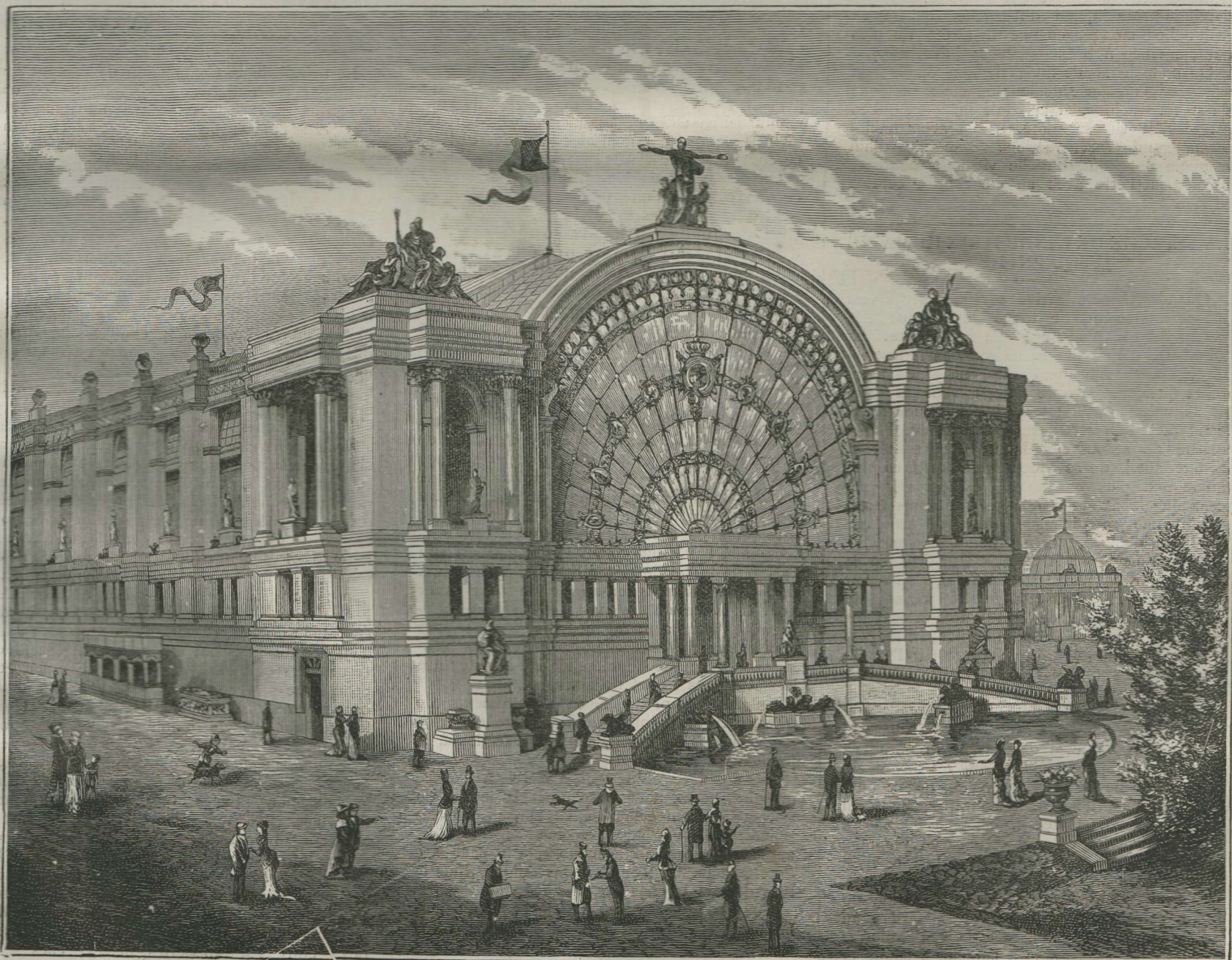
VUE DU PAVILLON DE L'ART ANCIEN.

A la suite de l'expédition française ayant pour but de venger les insultes faites aux Européens par la politique du dictateur Juarez,